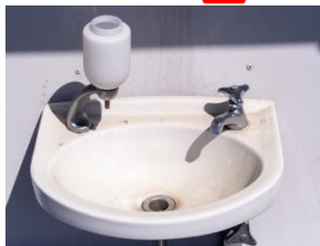
〈自動水洗への改修工事〉

主に肢体に障がいのある人、車いす利用者向けの工事。 開きドアのスライド式への変更や、ドアの幅員の拡張を行い、利便性を高める。 〈用途例〉：入口やトイレ等のドアの改修