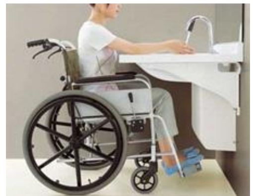
〈対応洗面所への改修工事〉